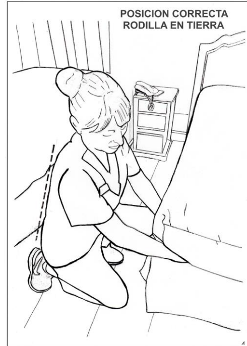
Figura 2 Rodilla en piso