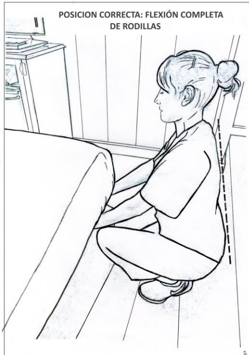
Figura 1 Flexión completa de Rodillas